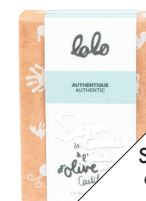
Savon de Castille à l'huile d'olive authentique Lolo, de La belle excuse (12 $; labelleexcuse.com ).