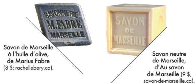
Savon de Marseille à l'huile d'olive, de Marius Fabre (8 $; rachelebery.ca).