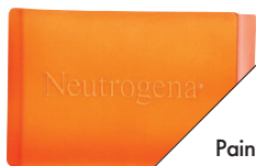
Pain facial transparent, de Neutrogena (8 $ le paquet de 3).