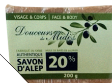
Savon d'Alep en bloc, de Douceurs du Midi (10 $; bio-terre.com).

BON À SAVOIR La mention de 16 % ou de 20 % d'huile de baies de laurier sur les emballages est gage de qualité.