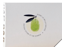
Pain de savon rafraîchissant exfoliant au sel de mer, de La belle excuse (12 $; avril.ca).