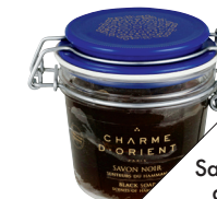
Savon noir Senteurs du hammam, de Charme d'Orient (37 $; rainspa.ca ).