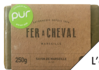
L'authentique savon de Marseille, de Fer à cheval (7 $; avril.com ou boutiquepur.com).