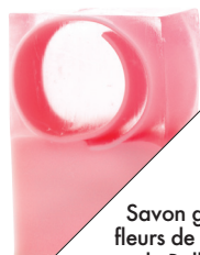
Savon glycérine fleurs de plumeria, de Bella Pella (8 $; bellapella.com).

BON À SAVOIR Le savon transparent fond, hélas, plus vite qu'un savon traditionnel, d'où l'importance de le tenir loin de l'eau stagnante ou, mieux encore, de le faire sécher à l'air libre entre les utilisations.