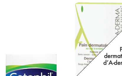
Pain dermatologique, d'A-derma (10 $).