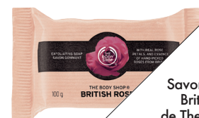
Savon gommant British Rose, de The Body Shop (6 $; thebodyshop.com).

BON À SAVOIR Comme sa texture est moins fondante que celle d'un gommage en crème, il ne s'emploie qu'une ou deux fois par semaine.