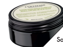
Savon noir rééquilibrant Aromachologie, de L'Occitane en Provence (24 $; loccitane.ca ).