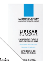
Pain physiologique antidessèchement Lipikar Surgras, de La Roche-Posay (10 $).