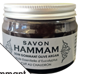
Soins gommant olive argan, de Savon Hammam (20 $; boutiquepur.com ).