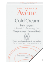
Pain surgras Cold Cream, d'Eau Thermale Avène (9 $).

BON À SAVOIR Il cajole l'épiderme, mais ne nous permet pas de passer outre l'application d'un lait ou d'une crème hydratante après le nettoyage.