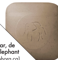
JuJu Bar, de Drunk Elephant (35 $; sephora.ca).