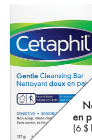
Nettoyant doux en pain, de Cetaphil (6 $ le paquet de trois).