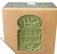
Noble d'Alep Royal, de Pür (9 $; labriseverte.ca ou boutiquepur.com).