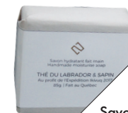
Savon Thé du Labrador & Sapin, de Savonnerie Deux (8 $; savonnerie2.com).